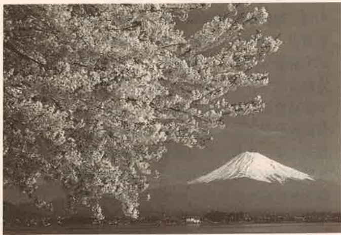
日本富士山 Fuji Mountain, Japan