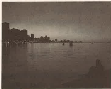
美國芝加哥城的密西根湖畔 Lake Michigan by Chicago, USA

按 人文地理學界定，中西部是指美國大湖區及鄰近的大平原，幅員廣大，包含了密西根、俄亥俄、印第安納、威斯康星、伊利諾、肯塔基、明尼蘇達、艾爾瓦、密蘇里、北達科他、南達科他、尼布拉斯加、堪薩斯等十三州。芝加哥是其中最大的都會，按人口計算，是美國第三大城，中西