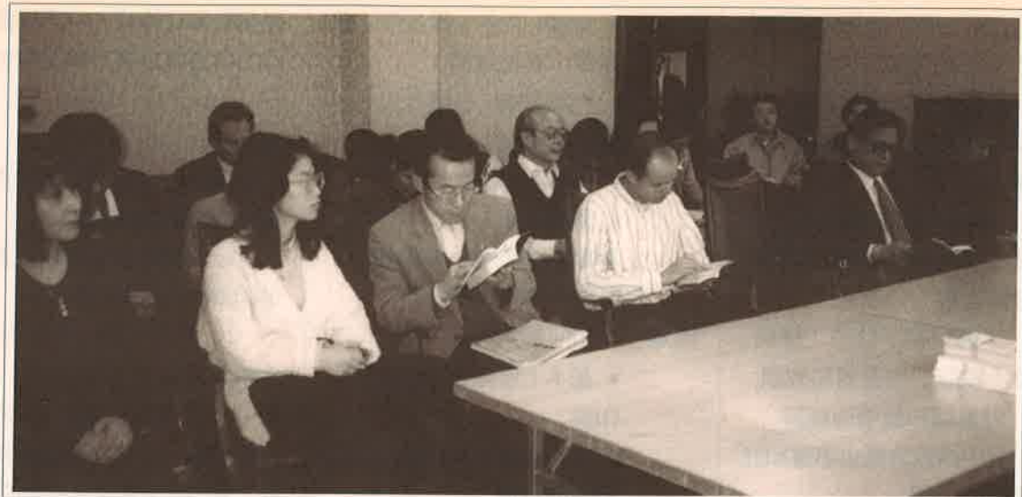
查經班 Bible Study