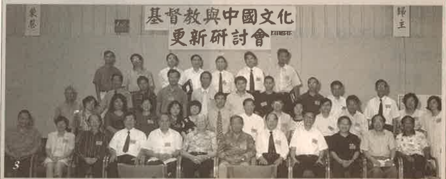
1. 個人回應 Individual response 2. 分組討論 Group discussion 3. 4. 全體與會者合影 All the participants of the symposium