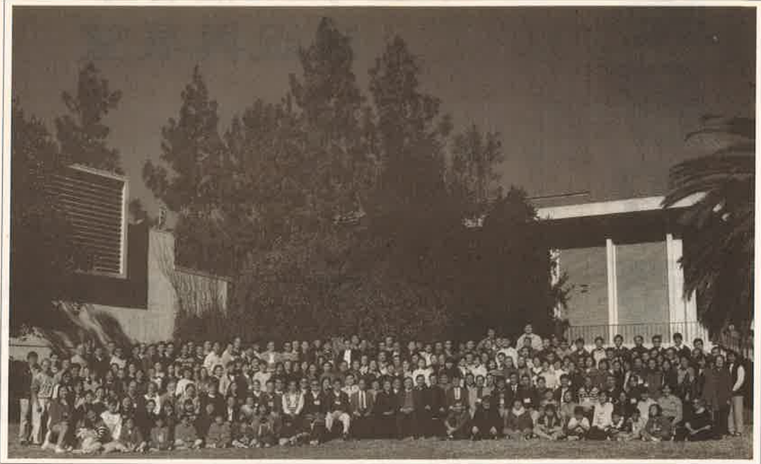
由中國福音會在美國加州主辦的1997年第二屆「中國學人培訓營」 The 2nd Overseas Chinese School of Servanthood training camp held in California, USA in 1997