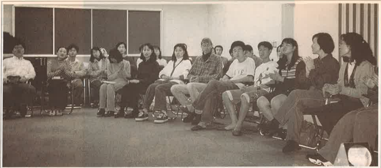
音樂佈道會 Music Outreach Program