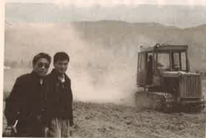
1. 2. 3. 短宣隊員參與實驗農場、醫療及教育等方面的服事 Short-term team members served in the fields including farming, medical, and education

他們的生活比起台灣早期的生活好多了，根本不需要改善。讓他們保存原有的純樸。日出而作，日落而息的農業生活是件極美的事，不需要將現代的文明來污染他們的單純。沒錯，或許沒有現代文明的方便，但基本的生存條件卻相當不錯。我們想一想，若帶進一些輕工業，使他們的客廳成為工廠，除了給他們帶來經濟上更富裕外，還有甚麼呢？相信沒有，反而可能帶來更多的罪。因此我們禱告，求神給我們的感動，不是在經濟、物質上的事奉。