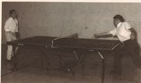
會議休息期間的「乒乓球賽」 Attendants playing Ping Pong during the break of the conference

本人殷切禱願我中華教會愛主弟兄姊妹熱切參與此劃時代的中華文化更新、倫理重建、神學處境化的偉大工程。