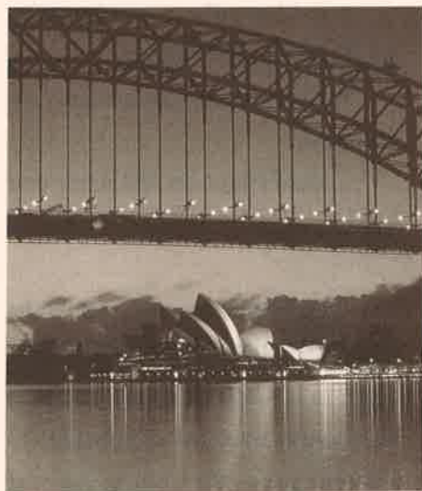
澳洲悉尼 Sydney, Australia

紐 西蘭和澳大利亞孤懸南半球，地廣人稀，皆是受基督教文化影響的民主國家，各級教育發達，社會福利制度完備，種族歧視的法律久已廢止，且實行多元文化政策。華人移居紐、澳約有一百五十年的歷史，在白人社會立足較早的以廣東四邑淘金客的後裔、星馬及香港早期的留學生畢業之後