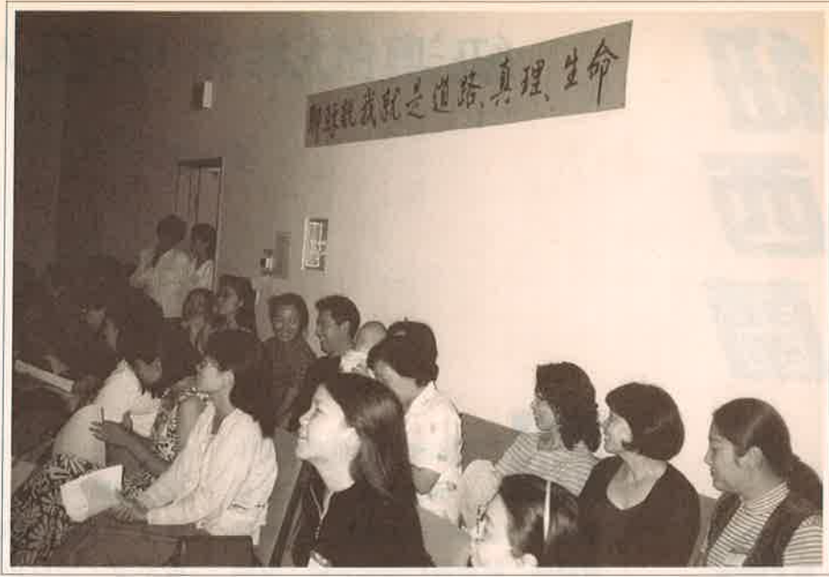
查經活動 Bible Study

centers are always good opportunities to make friends with these Chinese and to share with them personal experience and Christian love.