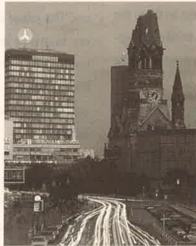
德國柏林 Berlin, Germany

There was only one Chinese family Bible study group in Hamburg before 1978. As soon as the coming of Vietnamese-Chinese refugees by the end of 1978, the Freundeskreis Fur Mission Unter Chinesen in Deutschland e.V. (Friends of Missions to Chinese in Germany, FMCD) began to organize cultural-evangelistic meetings. With the help of Chinese Overseas Christian Mission (COCM) and Chinese short-term mission teams, visitations were made to refugee camps and university cities. Gradually, similar Bible study groups began to function in other cities. To-