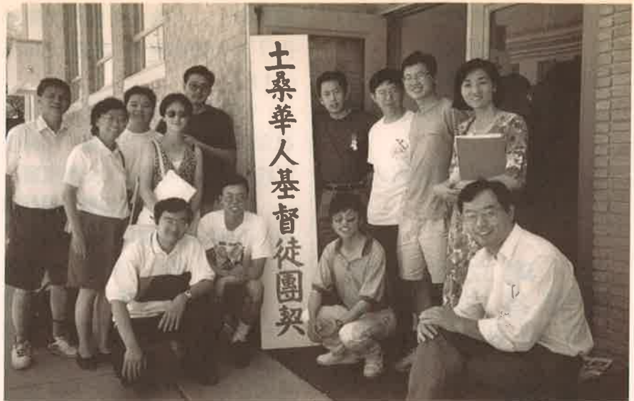
美國加州洛杉磯神州團契土桑短宣隊與鄰州土桑華人基督徒團契部份弟兄姊妹合影