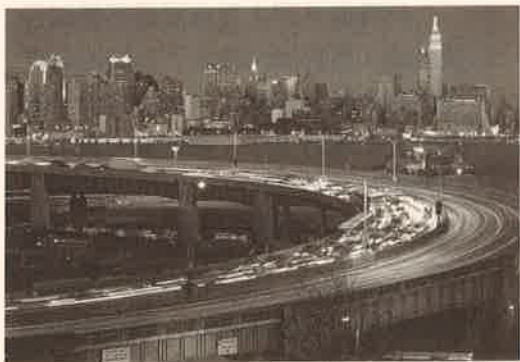
美國紐約市 New York, USA

由於東岸離歐洲最近，而歐洲的中國學人事工仍在起步的階段，因此，紐英倫區教會的負擔是：認領歐洲地區，作為宣教的工場。未來將定期派短宣隊去歐洲，專門向中國學人傳福音。我們盼望北美的經驗及所結出的果子，能在其他地區拓展中國學人事工。