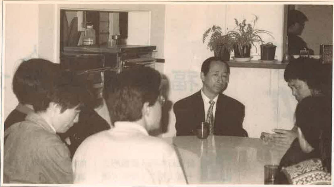
紐西蘭奧克蘭市西人教會中的大陸學人團契 Mainland Chinese Fellowship at a local church in Auckland, New Zealand

構（如中信）和基督徒也熱心地向他們傳福音。在奧克蘭更有一間由中國來的牧師牧養的教會，成員以中國人為主。他們藉著家庭福音聚會、佈道會、個人佈道、生活見證、福音廣播及文字向他們傳福音。