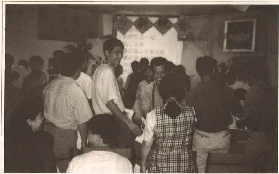
迎新晚會結識新學人 Welcome party reaching out to new students/scholars