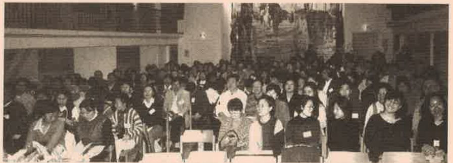
為數約三百名之主內中國留學生從德國各地前來赴會

洲各地華人教會多半沒有牧者，盼望海外華人教會多多為此代禱，以歐洲華人事工為宣教工場，並差遣更多工人前往開荒宣教。