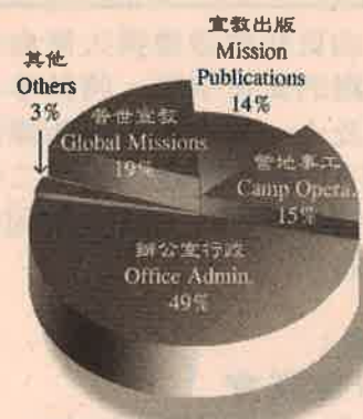
2001 年首季支出分配圖 2001 1st quarterly Expenses Distributions