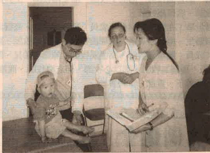
「希望診所」正式開幕的頭一天 醫生護士們正忙於為一位小童診病

19377 Lemmer Dr., Tarzana, CA 91356, U.S.A. Tel:818-996-5783 E-mail:BJ285@LAFN.ORG