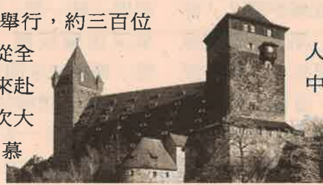
這次造就營是在這幢有數百年歷史之古堡改建成的青年旅舍內舉行

國的留學生，學成後絕大多數需立即返國。他們回國後將發揮重要的影響，可能演化成中國將來福音化的主要鑰匙。