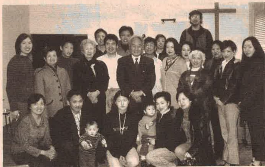
盧森堡華人教會弟兄姊妹及執事們與王牧師合照