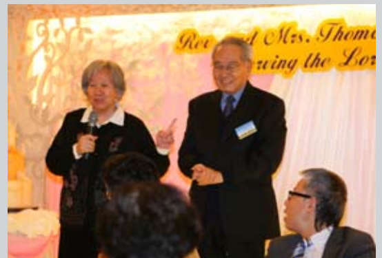
王師母分享夫妻相處之道