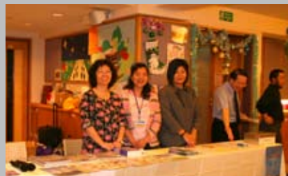
書攤上的同工與義工

為 讓一些舊同工和友好與王牧師、師母有更多團聚的時間，在11月28日安排了一次晚膳，筵設5席，大家暢談當年，興奮不已！更令王牧師和師母驚喜的，幾位多年未見的舊同工恰巧從海外回港，這真是團聚了！