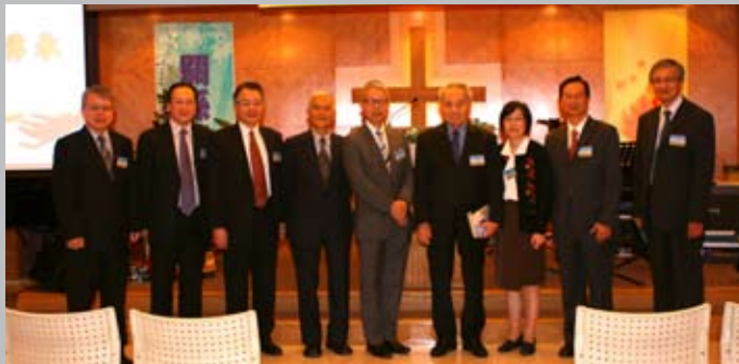
香港董事與講員合照