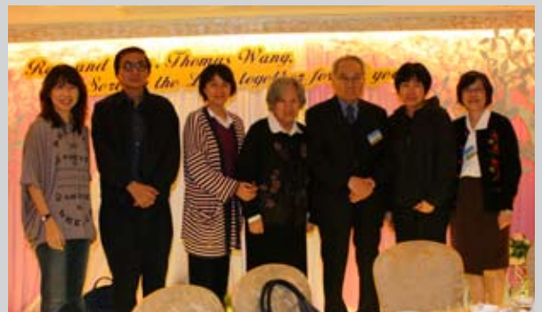
王牧師夫婦與昔日同工