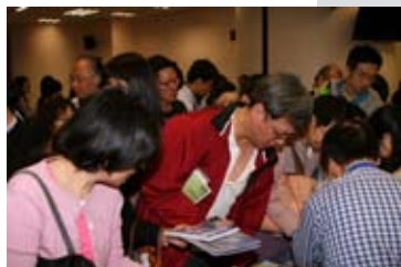
會眾到書攤來選購